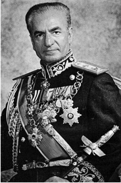
Muhammed Rıza Şah Pehlevi