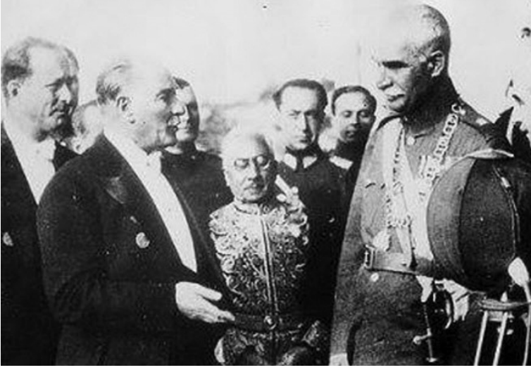
Atatürk ve Rıza Şah Pehlevi