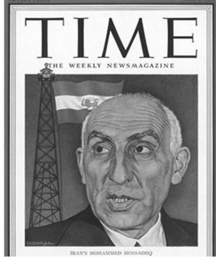
Time Dergisi'nin "Yaşlı, tuhaf bir büyücü..." olarak nitelediği Muhammed Musaddık