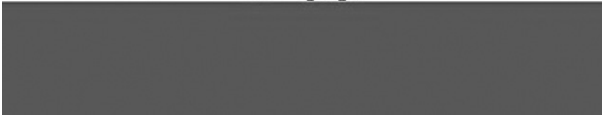
İran Bayrağı (Pehleviler Dönemi)