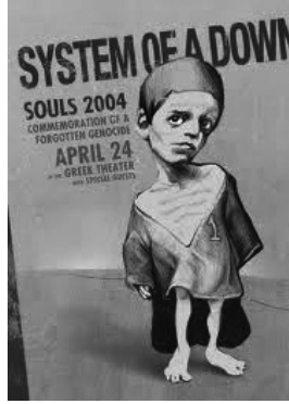
"Unutulmuş soykırım", System of a Down

Türkiye'nin ve Atatürk'ün dünyadaki kuvvetli muhaliflerinden Ermeni grup System of A Down konserlerinde Ermeni diasporasının propagandasını yapıyor, bizlere en ağır hakaretleri ediyor ve ülkemiz topraklarındaki Ağrı Dağı'nı sembolize eden "Holy Mountains"i söylüyordu.