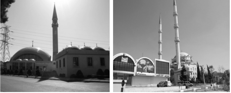
Fotoğraf 9 / 10: İSTOÇ Yeni Camii (solda), İSTOÇ Camii ile ön cepheleri reklam ve ilanların istilası altındaki işyerleri (sağda)