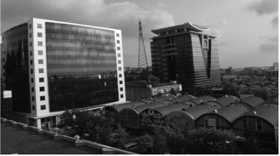
Fotoğraf 2: Aynalı/lüks İSTOÇ Ticaret Merkezi plazaları ve tek tiptonozlu esnaf binaları

İSTOÇ Ticaret Merkezi Sitesi, küresel ilişkilere bağlanmayı belirten kendi başına bir odak ve mimari yapılaşma olmasına rağmen bununla yetinilmemiş, siteyi işaretleyen iki büyük cami yapı kompleksiyle bütünleştirilmiştir. Bu siteyi oluşturan her yapı birimi birbirlerini bütünleyen ve belirleyen farklı unsurlar olarak ele alınmalıdır. Küresel ilişkiler çerçevesinde dikkate alınması gereken başka bir husus İSTOÇ'un coğrafi konumudur. İSTOÇ belli bir mimari kimliğin belirticisi olmakla birlikte gerçek anlamını TEM Otoyolu'nun yanı başında bulunması, yolu nitelemesi ve tanımlaması, havaalanına yakınlığı, sitenin TEM Otoyolu üzerinde kalan kısmında inşaat halindeki otel ve AVM'si, Oto-Ticaret Merkezi, büyük lüks plazaları gibi küreselleşmenin de özelliği olarak gösterilen daha bütünsel çerçeve içinde bulmaktadır. Başka bir deyişle, İSTOÇ Ticaret Merkezi ve camileri küreselleşme eğiliminin ve farklılaşmaya dayalı yeni muhafazakâr kimliğin ifadesi olarak öne çıkmaktadır. Mimari tasarımlar, tek başlarına değil çevreleriyle birlikte değerlendirilirler. Bir yapı veya yapı topluluğu bulunduğu bölgenin toplumsal özellikleri ve temsil ettiği dünya görüşüyle birlikte bir kimliğin niteleyicisi olmaktadır. Bu sebeple İSTOÇ da mekân-çevre-mimari yapı ilişkisi bağlamında değerlendirilmelidir.