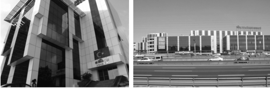
Fotoğraf 3 / 4: İSTOÇ Ticaret Merkezi Yönetim Binası (solda), İSTOÇ Oto-Ticaret Merkezi ve önündeki lüks plazalar "Kiralık VIP Ofisler" brandasıyla (sağda)