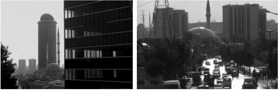
Fotoğraf 7 / 8: Alışveriş merkezi ve otel olarak tasarlanan inşaat halindeki İSTOÇ Saray (gökdelene bina), İSTOÇ Camii, esnafın dükkanları (alt kısımda, tek tonozlu yapılar) ve İSTOÇ'un içerisindeki lüks işyeri binalarından biri ile birlikte İSTOÇ Ticaret Merkezi'nden bir görünüm (solda), İSTOÇ Yeni Camii, küçük üreticilerin iş yerleri, dev plazalar ile İSTOÇ Çevreyolu'ndan bir görünüm (sağda)