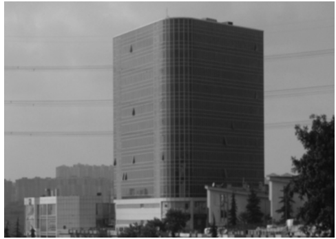
Fotoğraf 5 / 6: TEM Otoyolu üzerindeki İSTOÇ plazalarından (“Kiralık VIP Ofisler”den) biri (solda), İSTOÇ Ticaret Merkezi Sitesi’ndeki kütleli, dev aynalı bina (sağda)