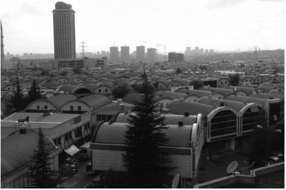
Fotoğraf 1: İstanbul Toptancılar Çarşısı (İSTOÇ) Ticaret Merkezi (soldaki gökdelen tarzı yüksek bina ve alt kısmındaki uzantısıyla İSTOÇ Saray, tek tip/tonozlu yapılar ise esnaf dükkanlarıdır)

Türkiye’deki küresel ilişkiler sistemi ve post-endüstriyel döneme geçiş sürecini, geleneksel üretim modellerinden uzaklaşıp küreselleşen piyasa ilişkilerine yaklaşan İSTOÇ Ticaret Merkezi Sitesi ve camileri doğrudan örneklendirmektedir. Post-modern dünyada modern zıtlıklar ortadan kalkmıştır. Böylece İslamiyet ile küreselleşmenin uyumlu belli yönlerinden bahsetmek mümkün olmaktadır. Özellikle 1980 sonrası şehir dindarlığı ve yeni muhafazakârlaşmadan söz edilmesi tesadüf değildir. Önceki iki yazımızda kapitalizm-İslamiyet ilişkisi ve şehir dindarlığını ekonomik açıdan ayrıcalıklı kesiminin sivil yerleşim / özel konut yeri-sitesi üzerinden tartışmıştık. 14 Bu yazıda İSTOÇ camileri aracılığıyla küresel piyasa ilişkilerinin yerelde aldığı biçimi, dinin küresel düzen içinde hem farklılaşmasını hem de uyumunu, küresel ilişkilere dayanak oluşturan iktisat, tüketim, ulaşım, turizm, kültür, ticaret ilişkileri içinde ele alarak, küre-muhafazakâr sivil konut yerleşim merkezi ile ticari işyeri yerleşim merkezi arasında da bir bütünlük oluşturmuş olaca-