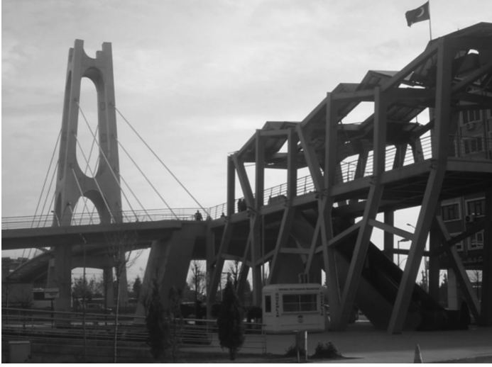
Calatrava tasarımı köprülere benzetilmeye çalışılan üstgeçitler

İzmit'te Mies'in tasarımı olan ve dünyada çokça taklidi bulunan cam prizmalardan esinlenen örnekler olmakla birlikte, bitişik nizam yapı örneklerinde cephesi yarı şeffaf ve mat malzemelerle kaplı örnekler de bulunmaktadır. Camın iç ve dış ayrımını ortadan kaldıran yönünü vurgulamak için Mies tarafından kullanıldığı sıkça dile getirilen bu tasarım yaklaşımı, pek çok yapının içindeki mekanların kullanımı açısından alışverişe dayalı dünyanın, dış cephede de yansıtılmasına dönüşmüştür. Tıpkı, bir gözü görmeyen bir adamın gözlüğünün görmeyen gözüne ait olan camına reklam alması 26 gibi ironik bir yaklaşımla, cam kaplı yapı cepheleeri körleşmiştir. Yapının içindekinin dış dünya ile kurduğu ilişki yerine, iç mekanda satılan ürünlerin dışarıya yansıtılması ön plana gelmekte, reklamın mesajı binanın görselliğinin önünde algılanmaktadır.