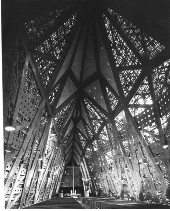
Wallace K. Harrison'un Stamford'da (California) Gotik kilise tasarım yaklaşımı ile inşa ettiği kilisesi (Kaynak: Bülent Özer, Yorumlar Kültür Sanat Mimarlık , YEM Yayınevi, İstanbul 1993)

Simge ya da avangard olarak sözünü ettiğimiz yapılar, çağının mimari yaklaşımını belirleyen, tüm yaratıcı potansiyellerin değerlendirildiğini anlatan diliyle, inşa edildiği kentte, ülkede ve dünyada dikkat çeken önemli kilometre taşlarıdır. Ancak öncü ve avangard olmaları nedeniyle taklit edilmeleri en kolay örneklerdir. Bu sebeple, avangard bir yapının öncü olma ömrü, taklitlerinin hızlı çoğalması nedeniyle sıradan bir yapıya göre daha kısadır. Sözgelimi, Mies van der Rohe'nin cam prizmaları, dünyanın pek çok kentinde taklit edilmiştir. Mies'in ilk olarak Lake Shore Drive Apartmanları'nda deneyimlediği prizmatik cam kutu yapının bitirildiği günkü etkiyi, dünyanın hemen hemen her kentinde taklitlerinin olması nedeniyle artık sağlayamamaktadır. Mies'in yapısı birebir taklit edilebilmesine rağmen, ekspresyonist özelliğe sahip simge yapıların taklit edilmesi daha çok bitmiş ürünün anlamsal dışavurumunu belirleyen dil özelliklerinin kullanılmasıyla gerçekleşir. Tüketim, işaret, kimlik değeri oluşturan bazı bileşenlerin kendi bağlamları dışında yeniden üretilmesi gibi.