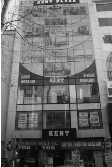
Saydam yüzeyleri tümüyle reklam panoları ile kapanmış kör bina cepheleri sıkça rastlanan örnekler arasındadır