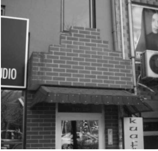
Selçuklu taç kapılarına özlem duyan bir başka mimari çaba