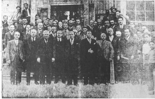
28 Ekim 1945 Türkyolu Gazetesi

İzmit’te gündelik hayatın içinde yer alan ve 20. yüzyılın ortalarına tarihlenen uygulamalarda farklı inşaa sorunları yaşanmıştır. Bu durum, gerçekte sorunsuz yapılar inşa etme isteği olan İzmit halkının zihninde yarattığı mekanlarla, ortaya çıkanlar arasında yarılmaya neden olabilir. Bununla birlikte, zaman kavramının da zihinlerde önemli bir iz bıraktığı malumdur. Osmanlı İmparatorluğu’nun son dönemlerinden itibaren eksikliği hissedilen kamusal yapılara ulaşmaları ciddi mücadelelerle gerçekleşen İzmit halkının “beklemeyi bilmek”, “sabretmek” gibi kavramları gereğinden fazla özümstedikleri söylenebilir. Uzayan inşaat süreçlerinde ortaya çıkacak yapıların bekleneni karşılamaması nedeniyle her seferinde bekleme dışında hayal kırıklığı gibi bir bedelin ödenmesi de önemli bir sorundur. Cumhuriyet sonrasında Türkyolu Gazetesi’ndeki halkın beklentilerini ve ilgisini arttırmak üzere kente dair verilen haberler, beklenenin ortaya çıkması sürecinde, inşaatla ilgili en ufak bir gelişmenin bile paylaşılmasını gerektirmiştir. Gazete haberleri, yeni yapılan binalar için sabretme sürecini canlı tutmak ile zamanın pozitif olan yönünde