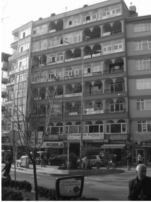
Elhamra Sarayı'nın cephesi taklit edilmiş gibi görünen bir başka örnek

Ya da farklılık yaratmak adına kemerlerle süslü cepheleriyle Endülüs etkileri veren oryantalist cepheye sahip bir apartman örneği gibi, kentin herhangi bir noktasında "ikon" iddiasında bulunmayan basit mimari taklitler, yabancılaşmış halde varlığını sürdürür. Bu karışık uygulamalar kimi zaman bir yapıda mimarlık öğeleri basitleştirilerek iki farklı üslubun aynı anda kullanılmasıyla da gerçekleşebilmektedir. Bir apartman örneğinin cephesinde kemerli pencerelerle (sonradan ilave edilen kemer biçimindeki bantlarla), Art-deco öğeler birarada kullanılmıştır. Kimi zaman yapılar, antik döneme aitmişçesine İyonik sütun başlıkları ve bezemelerle tezyin edilmekte, kimi zaman Miesvari cam prizmalar biçiminde ortaya çıkmakta, Selçuklu mimarisinden alıntılama, taklidi taklidi olacak biçimde soyutlaştırılan taç kapı örneklerine benzetilmekte, 1940'lara ait bir konutun pencere ve kapı girişlerine sonradan Rönesans palazzolarında görülen korniş ve konsollar eklenerek, yapı inşa edildiği dönem özelliklerinden soyutlanmakta ya da yeni bir yapı Art-deco elemanlarla eskitilmektedir. Her türlü mimari üslubun var edilmeye çalışıldığı ortam, kentin tarihi ve potansiyelleri iyi anlayamadığı için biçimsel olarak kullanılmakta, mimariyi zenginleştirmek yerine, sahte anlamlar yayan taklitlerle, görsel olarak yorucu ve özensiz ürünlerin uyumsuz bir aradalıklarının ortaya çıkmasını sağlamaktadır.