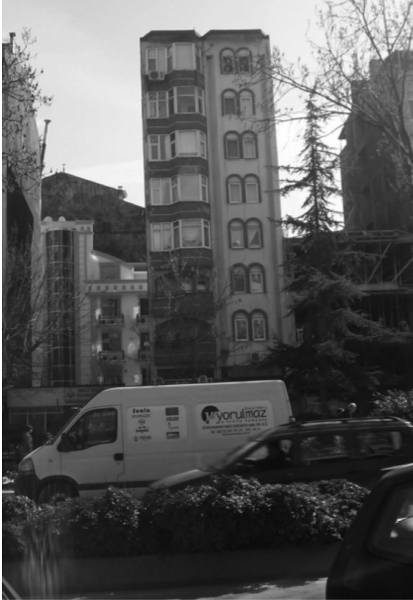
Art-deco tarzı çıkarmalar ve kemerli pencereler