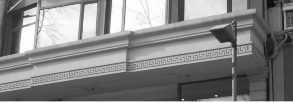
Meandr motifleri ve antik dönem etkileri